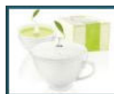
Tè e infusi